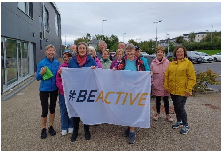
Déanann Grúpa Siúlóide an Chaisleáin Ghearr agus Bhaile an Phoill ceiliúradh ar an tSeachtain Bí Gníomhach

Lean an HGC agus an GSP de thacaíocht a thabhairt do ghrúpaí siúil pobail áitiúla sa