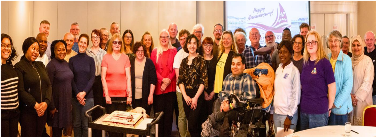
Comhaltaí ag ceiliúradh 10 mbliana de GCCN in 2024

In 2024, rinneadh comóradh 10 mbliana ó bunaíodh Líonra Pobail Chathair na Gaillimhe mar an Líonra Rannpháirtíochta Poiblí (PPN) i gCathair na Gaillimhe. Rinneadh an t-imeacht a cheiliúradh leis na comhaltaí uile ag Cruinniú Ginearálta Bliantúil 2024 agus ag Seisiún Iomlánach GCCN an tSamhraidh. Reáchtáil gach PPN eile ceiliúradh náisiúnta ar fud na tíre freisin, le haitheantas oifigiúil ag an 6ú Comhdháil Náisiúnta Líonra Rannpháirtíochta Poiblí an 17 agus an 18 Deireadh Fómhair 2024.