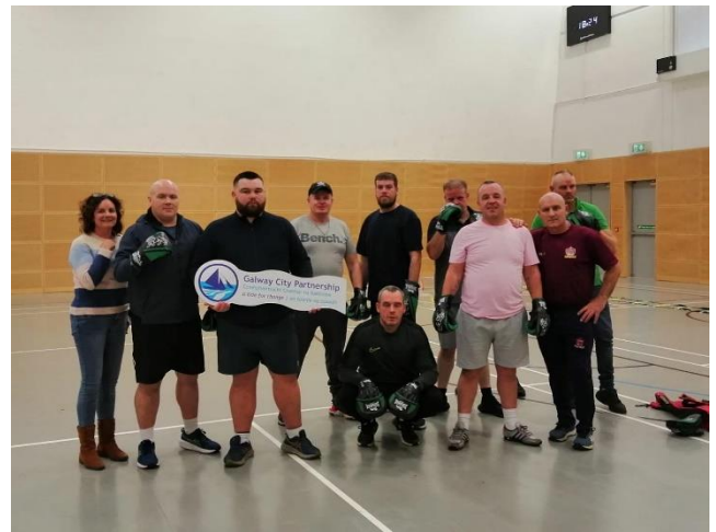
Grúpa Fir an Lucht Siúil Baile an Phoill

Lean an HGC agus an GSP de bheith ag obair i gcomhar ar imeachtaí agus ar ghníomhaíochtaí a chuireann gníomhaíocht cholainne, spórt agus aclaíocht chun cinn ar fud raon leathan den phobal. Orthu sin bhí: