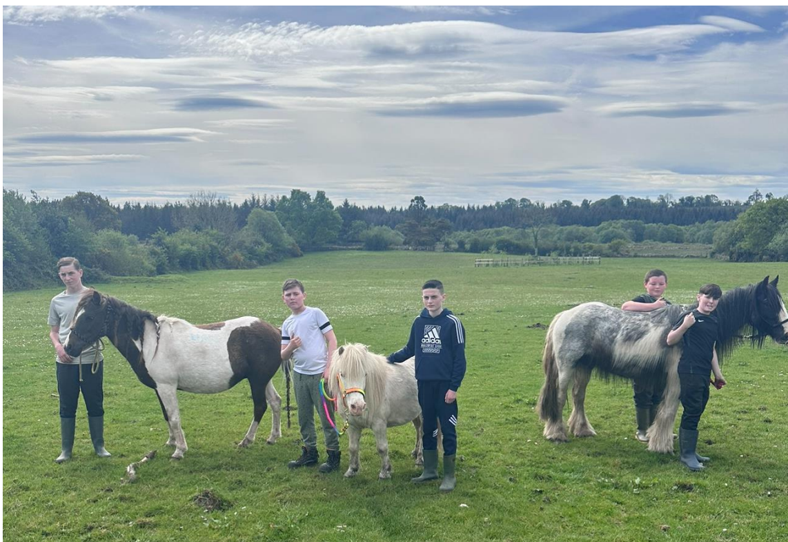
Rannpháirtithe i gclár Teiripe Eachaí Ghluaiseacht an Lucht Siúil i nGaillimh

Chomh maith le cláir agus tacaíochtaí 1:1, phleanáil an GTM roinnt imeachtaí pobail chun meabhairshláinte agus folláine dhearfach a chur chun cinn laistigh de phobal an Lucht Siúil i gCathair na Gaillimhe. Rinneadh ceiliúradh Lá Meabhairshláinte an Lucht Siúil ar an 8 Deireadh Fómhair le turas grúpa chuig Aifreann bliantúil i gCnoc Mhuire.