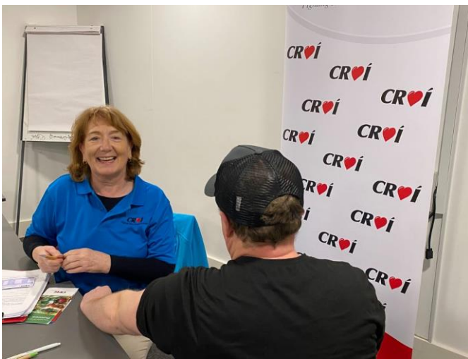
Seiceálacha Sláinte Croí na heagraíochta Croí le Grúpa Fir an Lucht Siúil Baile an Phoill

Cuireadh clár aclaíochta dornálaíochta ar fáil a bhí dírithe ar fhir an lucht siúil i mBaile an Phoill agus bhí an-tóir ag rannpháirtithe air, agus bhí sé beartaithe ag an ngrúpa leanúint dá ngníomhaíochtaí agus tús a chur le hoiliúint nirt agus aclaithe in 2025. D'éirigh go han-mhaith le Peil Siúil do dhaoine os cionn-55 bliana d'aois i mBaile an Phoill freisin. I gcomhpháirtíocht le Comhpháirtíocht Chathair na Gaillimhe (GCP) do na cláir seo, áiríodh Seiceálacha Sláinte Croí na heagraíochta Croí mar bhreiseán rognach agus fuair go leor fear a gcéad seiceáil sláinte déanta ar a gcroí agus rinneadh monatóireacht ar a mbrú fola.