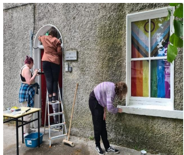
Ionad Acmhainní LADT+ Theach Solais : Uimh. 1 Cearnóg Theach na Cúirte