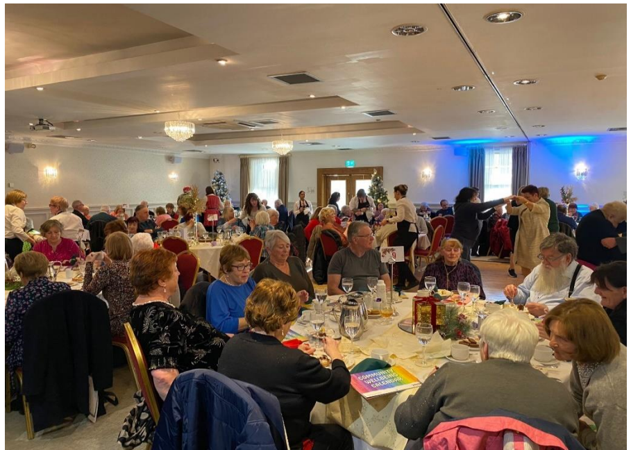
Ócáid Lón Nollag 2024 an HGC agus an GCP do dhaoine fásta níos sine a bhfuil aonrú sóisialta agus uaigneas orthu

Amhránaíochta pobail bunaithe go láidir sna háiteanna seo anois, agus feidhmíonn siad mar spásanna oscailte agus cuimsitheacha do mhuintir an phobail. Tagann na grúpaí le chéile gach seachtain i rith na bliana agus sheinn gach grúpa go poiblí ag imeachtaí sa chathair ar mhaithe le meabhairshláinte agus folláine dhearfach a chur chun cinn.