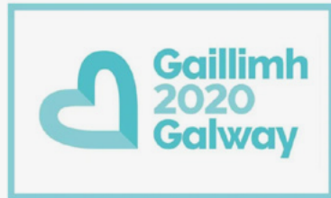
Galway – European Capital of Culture 2020