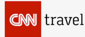
top 20 best places in the world to visit in 2020 according to CNN Travel.